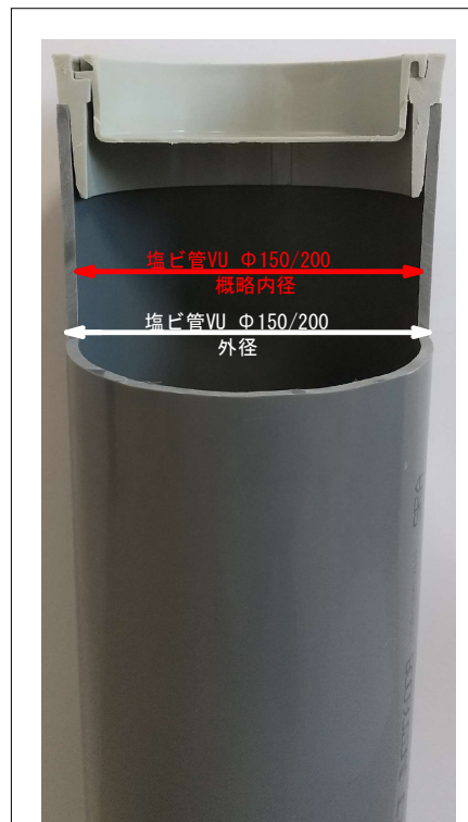
A-A' 断面イメージ写真